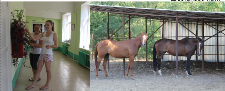
На летней практике. Готовим вуз к 1 сентября. А это наши лошади, вернее, нашего вуза. Я счастлива!!!

Спешу поделиться радостной новостью: я поступила в университет! Теперь я студентка Кубанского Государственного университета! Буду учиться на факультете «Математики и компьютерных наук» (Педагогическое образование (подготовка по двум профилям – Математика, Информатика и ИКТ)). Баллов по результатам ЕГЭ мне хватило, чтобы поступить на бюджетную форму обучения.